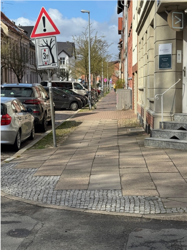
Volgerstrasse zwischen Kefersteinstr. und Lindenstr, Westseite