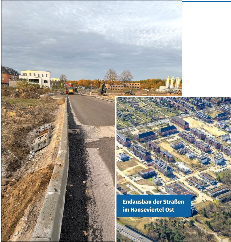
Endausbau der Straßen im Hanseviertel Ost